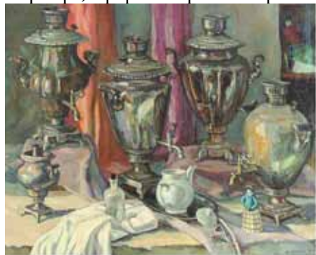
Натюрморт с самоварами. Серебряный. 1997 г. № 57х108

Можно сказать, что Двинянинов – художник большой многогранной культуры, тонкий знаток изобразительного искусства разных стран. Художник обладал огромной работоспособностью и самодисциплиной, он работал много, но легко и радостно. Им создано свыше пяти тысяч произведений. Любовь к жизни, к искусству сливались в нем в единое гармоническое целое и создавали источник его душевной чистоты и неиссякаемой творческой силы. В 1990-е годы искусство Двинянинова обрело всю полноту зрелого и ясного мастерства, направленного на выражение целостного и убежденного художественного мировоззрения. В этот период окончательно определились главные жанры – портрет, пейзаж, натюрморт, офорт. Его работы привлекают контрастностью светотеней.