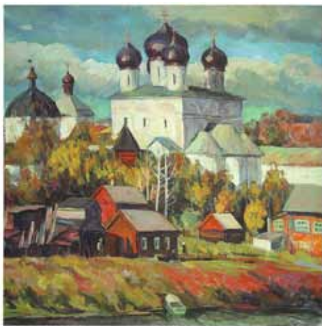
Осенний день. Трифонов монастырь. 1995 г. х. в. 60х60

Так в работе «Осенний день. Трифонов монастырь» (1995 г.) художник раскрывает город с другой стороны. Здесь представлен и сельский пейзаж, и набережная реки, и гордо возвышающиеся стены Трифонова монастыря. Именно в данной картине мы попадаем в старую, прежнюю Вятку. Лучи солнца озаряют купола