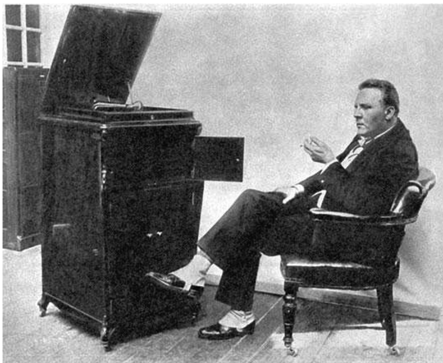
Фёдор Иванович Шаляпин у патефона